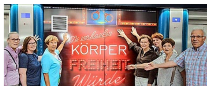
Mitglieder der Bürgerinitiative gegen Bordell vor dem Plakat, das sie am Oberstadtaufzug anbringen ließen.